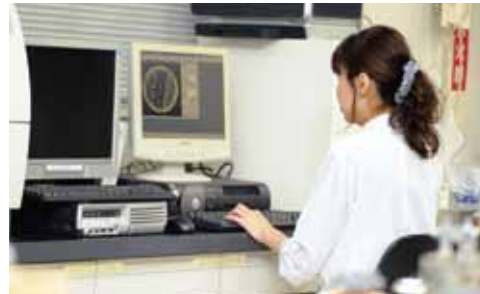
微生物検査の様子

このように、食鳥処理場における食鳥検査により、安全・安心な鶏肉を消費者のみなさんに提供することができるのです。