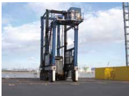
サンプリング現場

これからも、厚生労働大臣登録検査機関として、検査結果の信頼性を第一に考え、安全・安心な食生活の確保を目指し、地域貢献に努めていきます。