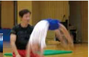
☆かっこよく☆バク転教室