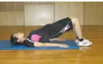
③股関節痛予防(太もも後ろ、お尻)