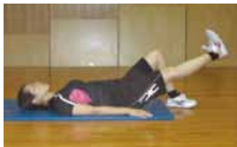
④膝関節痛予防(太もも前)

もちろん日常生活でもアークトレーナーと同じような効果がある運動を行うことができます。左記の筋力づくり運動は股関節痛予防（写真③）、膝関節痛予防（写真④）に効果的です。テレビの CM 中や、横になった時に取り入れてみましょう。日常生活で脂肪を燃焼するには、とにかく活動量を増やすことが大切です。歩く時間をつくる、家でラジオ体操やテレビ体操をする、外に出た時は意識して階段を使う、駐車場では車を遠い所に停めるなど活動的な毎日を過ごしましょう。いつでもどこでも体を動かしますます健康度がアップしますように。